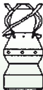
Ugelli a elica cilindrica