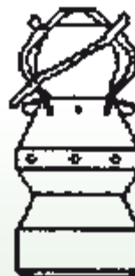
Ugelli a elica conica