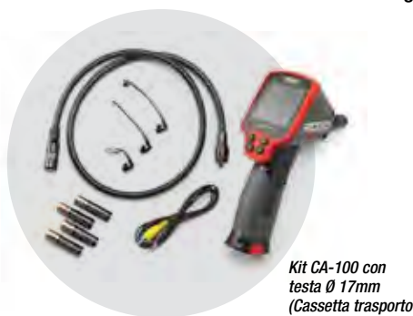
Kit CA-100 con testa Ø 17mm (Cassetta trasporto in dotazione)