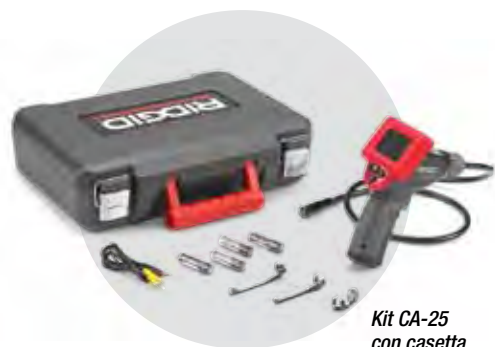
Kit CA-25 con cassetta