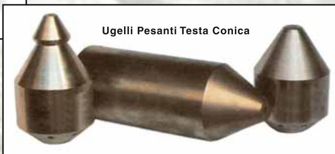
Ugelli Pesanti Testa Conica

Determinare il diam. e il numero di fori secondo il gruppo pompa e indicare la lettera corrispondente al diametro del foro come da legenda sotto riportata: