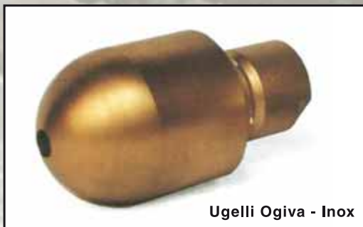
Ugelli Ogiva - Inox