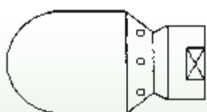
Ugelli Pesanti Testa Tonda