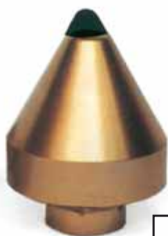
Ugelli Pesanti Testa Conica